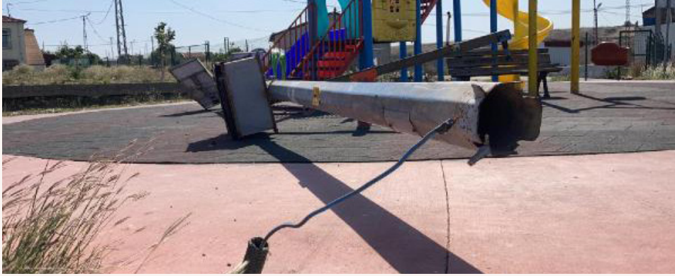
Şekil 3. İstanbul’da Parkta Üzerine Aydınlatma Direği Düşen Çocuk Haberi.

• Güvenlik ihmalinden kaynaklanan bir başka olay ise 15.09.2020 tarihinde basında yayınlanan, İstanbul Arnavutköy Hacımaşlı Mahallesi’nde meydana gelmiştir. 10 yaşındaki çocuk parkta oynarken aydınlatma direği çocuk üzerine devrilmiş ve çocuk hayatını kaybetmiştir.