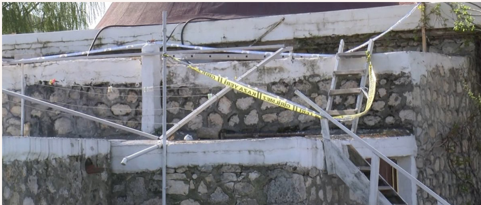
Şekil 1. Park sınırları içerisinde bulunan hamamın su deposuna düşerek hayatını kaybeden çocuk haberi.

• Daha önceden öngörülmemeyen, dikkatsiz bir şekilde tasarlanmış olan İstanbul Büyükkçekmece’de, 29.04.2021 tarihinde basında çıkan haberde, parkta oynayan bir çocuk park sınırları içerisinde bulunan hamamın su deposuna düşerek hayatını kaybetmiştir. Bu dikkatsizlik yerel yönetimlerin sorumluluğunda olup bir çocuğun hayatı güvenli ortam yaratılmadığından dolayı sona ermiştir.