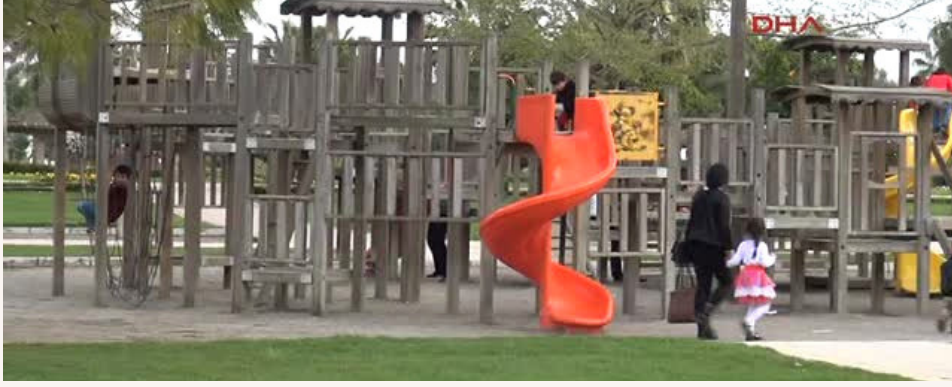
Şekil 2. Adana Parkta Düşen Çocuk Haberi.

• 18.03.2015 tarihinde Adana’da parkta oynayan 2,5 yaşındaki çocuk tırmanma zincirinden düşüp yaralanmıştır.