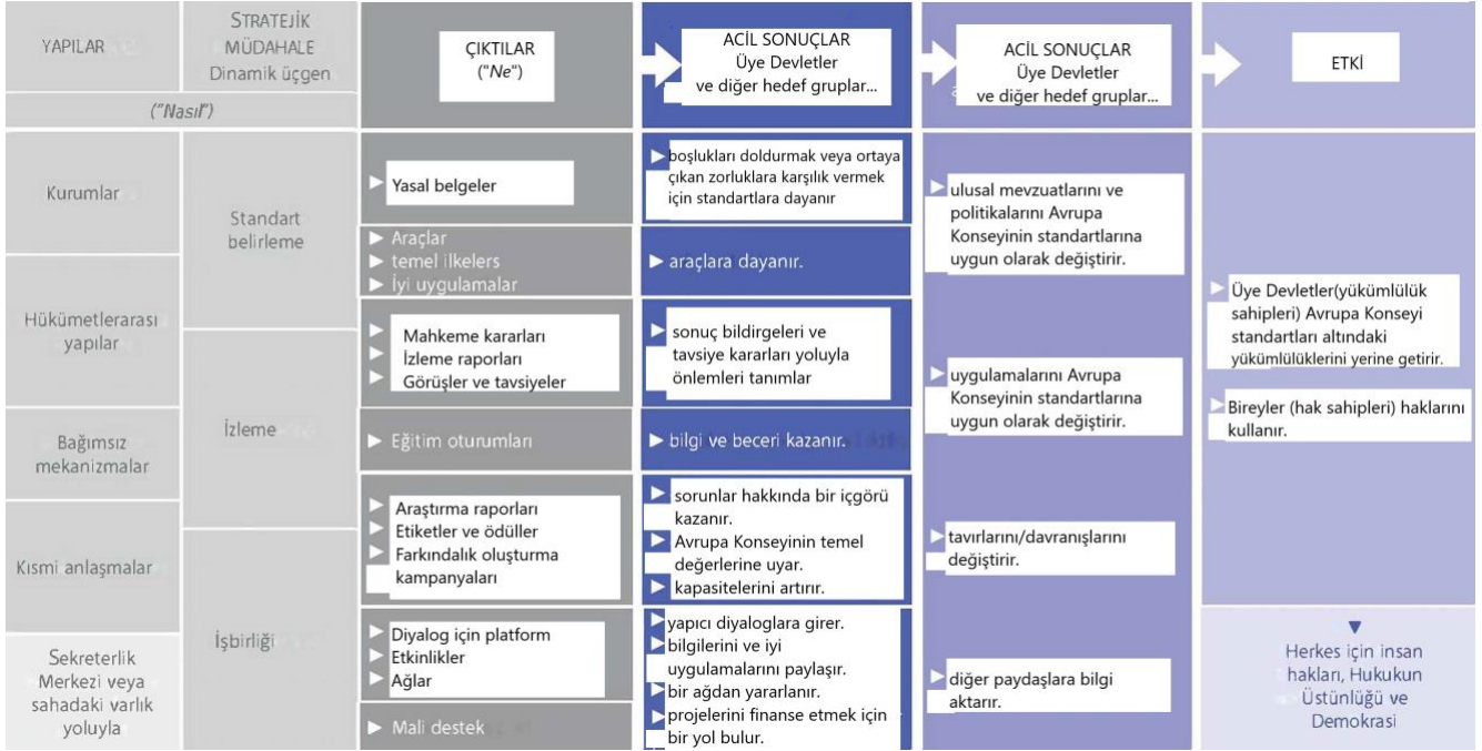
Şekil 1 - Değişim teorimiz: herkes için İnsan Hakları, Hukukun Üstünlüğü ve Demokrasiye doğru