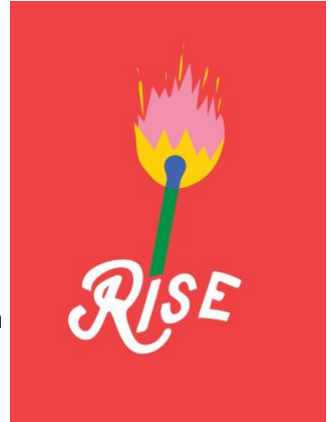
Safwat Saleem, Fine Acts@safwtf Çizimdeki yazının çevirisi: Ayağa Kalk

Hedef kitleniz karşısında zor bir problem gördüğünde, bu problemin yeni bir normal durum haline gelmesi, yani talihsiz ama kabul edilen bir referans noktası olma riski vardır. Bizim önümüzdeki zorluk, insanların aldığı kararların problemi nasıl yarattığını ve farklı seçimlerin bu problemi nasıl çözebileceğini göstermektir. Akıllı çözümlerin radikal fikirler olmaktan çıkıp mantıklı fikirlere dönüşmesi için iletişimi kullanarak, bu çözümleri teşvik etmek için gereken cesarete sahip olmamız gerekiyor. Kemer sıkma politikalarına karşı çıkabilirsiniz ama halk kamu harcamalarının gerçekten nasıl olduğuna inanmadığı sürece politikalar değişmeyecektir. Ciddi krizlerin içindeyken çözümlerden bahsetmek zordur ama en zor ve karanlık zamanlar, insanların ışığa doğru açılan bir yola en çok ihtiyaç duyduğu zaman olabilir.