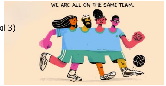
Çizimdeki yazının çevirisi: <Hepimiz aynı ekipteyiz>