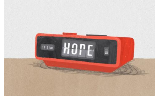
Safwat Saleem, Fine Acts– @safwtf